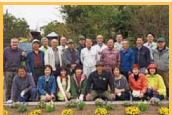
▲美しく手入れされた高月図書館前の歩道。館の前庭(出会いの森)の清掃にも取り組んでいる

11周年を迎えた昨年には、「日々コツコツと続ける取り組みがまちを変えていくはず」と改めて地域の環境美化を重視。以前から取り組んできた駅前の花壇整備に加え、高月小学校西側歩道と高月図書館前の花壇整備に取りかかりました。花壇敷地を区割りして、担当者を決めることで、責任をもって手入れをする意識をもつ仕組みを取り入れています。