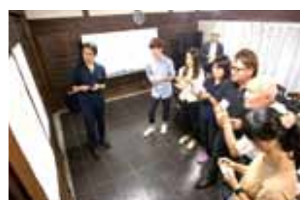
▲昨年着任したパートナーと市民活動を盛り上げよう

【と き】不定期(月1回程度) 【ところ】市役所本庁舎内 【参加費】無料 【対象】市民活動に興味をもち、若い感性で携わっていただける人を優先します。 市内の活動団体が一堂に会し交流を深める「つながりマルシェ(仮名)」の企画運営などについて考えていきます。