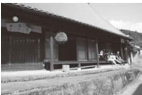
▲空家を活用した田舎暮らし住宅

通常の不動産契約では、空き家所有者と使用者の交渉のみですが、「空き家バンク」では、地元自治会や集落の意向を十分くみ取り、移住希望者とのマッチングを進めています。