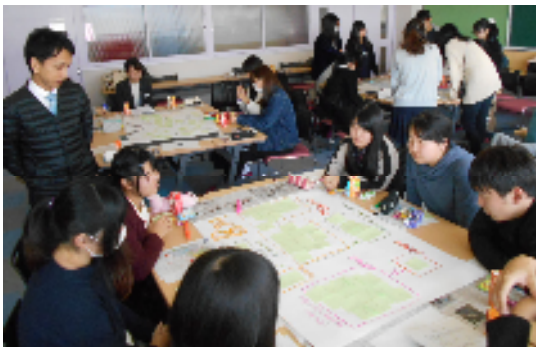
滋賀文教短期大学でのWS