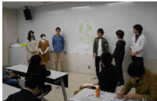
長浜バイオ大学でのWS