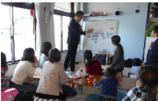
子育て応援カフェ L0C0 でのWS