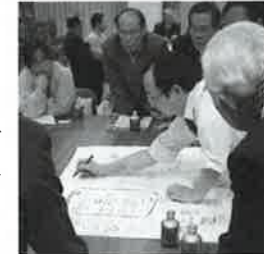
▲長浜まちづくり100人委員会の様子

☒ 市民参画機会の充実 【企画広報課】 長浜まちづくり100人委員会の取り組みを充実させ、市政への市民意見の反映に努めます。 あわせて、パブリックコメント等制度を見直す等、市民の市政参画機会を充実します。