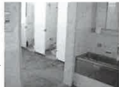
トイレ改修(イメージ)→

神前幼稚園移転改築事業 【教育総務課 2,300万円】 【H22~H23、4億円】 園児がいきいき学べる環境をつくるため、老朽化の著しい神前幼稚園の移転改築を進めます。 学校給食センター統合整備事業 【教育総務課 6億4,712万円】 【H23~H24、21億4,912万円】 長浜・びわ・虎姫の給食センターを統合し、炊飯施設を備えた新給食センターを建設します