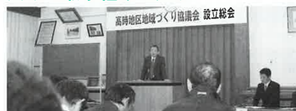
▲高時地区地域づくり協議会設立総会の様子

☒ 地域づくり協議会事業 【市民自治振興課 1,266万円】 【市民自治振興課】 地域づくり協議会において活発なまちづくり事業が行われるよう、特色ある独自の取り組みに対する支援を強化します。 <参考> H22年度末現在協議会設立 16地区