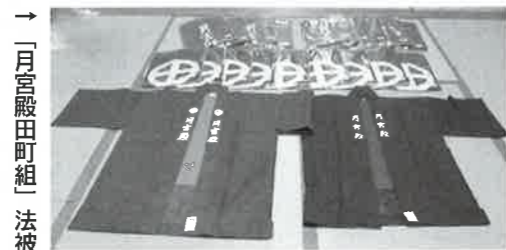
→「月宮殿田町組」法被