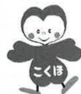
滋賀県の国保マスコット ホーブちゃん

●国民健康保険への加入届出 お勤め先の健康保険等の資格を喪失したとき、または被扶養者の認定を外れたとき