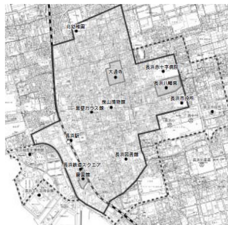
Quadro 1 [relacionado ao Sistema 1]

Caso corresponda aos requisitos do quadro 2 haverá acréscimo dos valores correspondentes, sendo o subsídio máximo ¥2.300.000.