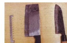
▲ Facas que estavam misturadas no lixo

No dia 11 de junho, ocorreu um incêndio em um caminhão de coleta de lixo, no município, que possivelmente foi causado por lata de spray descartada com o lixo não queimável. Ao descartar o lixo de forma errada, poderá causar acidentes graves e por em risco a vida de outras pessoas. Por isso, devemos conferir uma vez mais o modo de descartar o lixo e nos esforçarmos para realizá-lo corretamente.