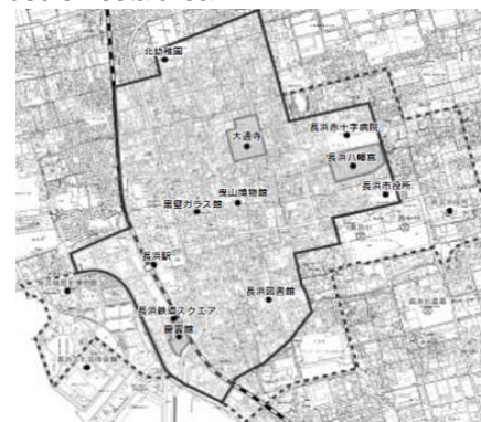
Cuadro 1 [Relacionado al Sistema 1]

En caso corresponda a los requisitos del cuadro 2, habrá un incremento de los valores correspondientes, siendo el subsidio máximo de ¥2' 300,000.