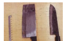
▲ Cuchillos que estaban mezclados en la basura.

El miércoles 18 de julio, un empleado sufrió una herida en la mano debido a un cuchillo que estaba mezclado con la basura no incinerable. No está prohibido desechar cuchillos en los lugares de recolección de basura, sin embargo, es necesario tomar las medidas pertinentes antes de desecharlas, a fin de evitar accidentes. Se solicita envolver el cuchillo con papel u otros, anotar el contenido en un lugar visible (ej. houcho/cuchillo, hamono/objeto cortante) y desechar. El 11 de junio se produjo un incendio en uno de los camiones recolectores de basura, se piensa que fue a causa de un tipo de lata de aerosol mezclado dentro de la basura no incinerable. Desechar la basura de forma errada es un peligro, debido a que involucran la vida de seres humanos; por este motivo, se solicita verificar nuevamente, la manera correcta de desechar la basura. Informes: Kankyuu Hozenka ☎ 0749-65-6513