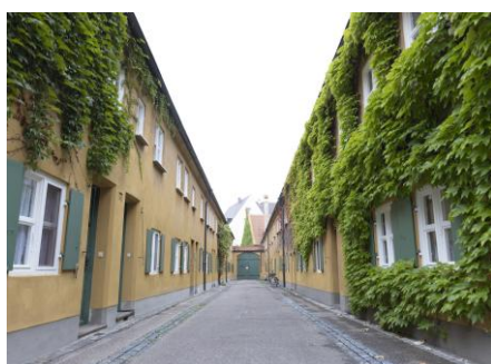
世界一古い福祉施設「フッゲライ」