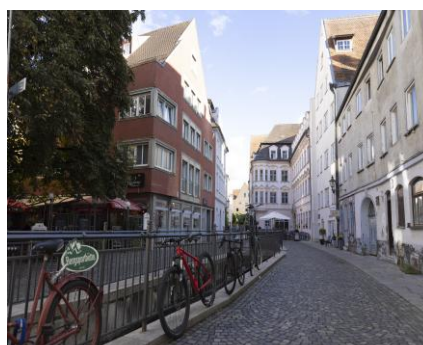
アウクスブルクの街並み