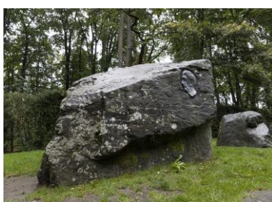
ディーゼル記念公園