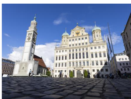
アウクスブルク市庁舎