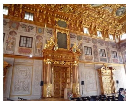
アウクスブルク市庁舎黄金の間