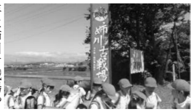
▲地域探検での子どもたち