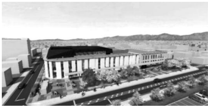
▲産業文化交流拠点完成予想図

①愛称②愛称の説明(最大200字)③氏名(ふりがな)④住所⑤年齢⑥電話番号を明記し、郵送、FAX、メールまたは直接下記まで提出してください。市ホームページからも応募できます。