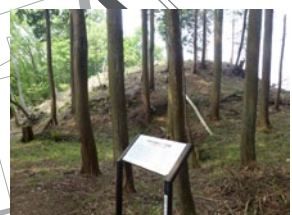
③ 古保利古墳群 古墳時代から飛鳥時代（3～7世紀）につくられた一大古墳群。丘陵線上の約3kmに渡って132基の古墳が見つかっている。琵琶湖から見られることを意識した立地は当時の重要な交流・交易の手段であった水運の影響と考えられる。