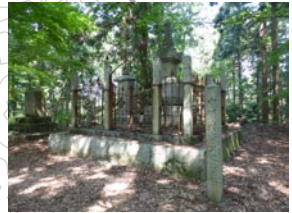
① 中川清秀の墓 賤ヶ岳の合戦における中川清秀の墓跡。敵将佐久間盛政の奇襲にあい、全員この地で全滅した。周囲には部分的に土塁が残っており、のちに墓碑が建てられた。