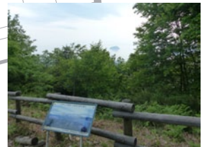
④ 山本山 陸上と琵琶湖を見渡す重要な位置にあることから、平安時代から戦国時代にかけて山城が築かれてきた。近年はオオワシ(メス)が越冬のための湖北に渡り、山本山をめぐらしており、その姿を一目見ようと野鳥ファンやカメラマンが多く訪れている。