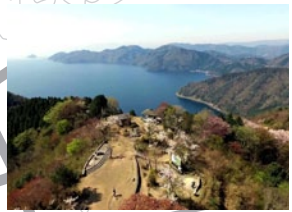
② 賤ヶ岳 余呉湖や琵琶湖を一望できるビューポイント。賤ヶ岳の合戦では桑山重晴の砦となり山頂周りには土塁跡が見られる。