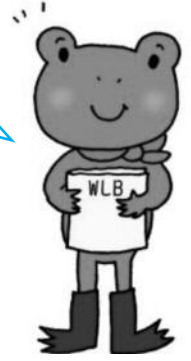
イラスト:タカノキョウコ

県民一人ひとりがライフスタイルや職場環境を見直すことにつながる広報・啓発活動を集中的に実施しています。