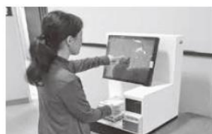
Imagen de la manipulación de la máquina