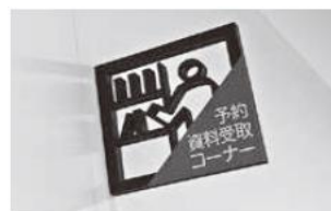
Símbolo del "Yoyaku Shiryou Uketori Corner"