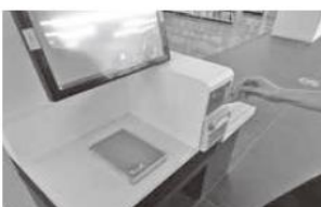
Parte frontal de la máquina