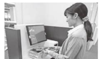
Máquina Automática de Alquiler de Libros Dentro del Corner