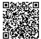
QRcode do site da prefeitura

Informações: Kourei Fukushi Kaigoka Tel.: 0749-65-7789