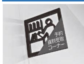
Símbolo do espaço