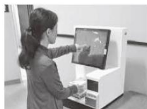
Imagem do mauseio