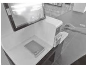
Parte frontal da máquina