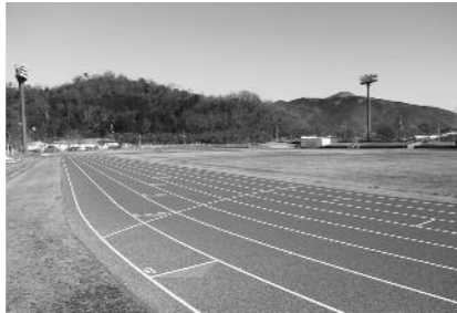
▲浅井ふれあいグラウンド(陸上競技場)