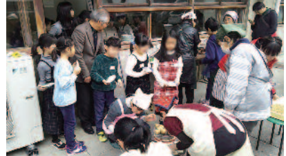
▲七輪であぶって焼きおにぎりを作った回は大好評

【開催頻度】原則月1回 【ところ】長浜まちづくりセンター（高田町）など 【参加人数】子ども30～40人と大人 【参加費】大人のみ100円