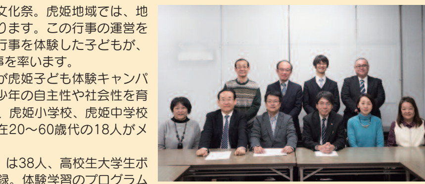
▲定期的な会議を開き、より良い子どもの育成のあり方を模索するメンバー。平成30年には、地域貢献に励む団体を顕彰する「びわ湖ほのほの大賞」の子ども育成部門を受賞。

今月の表紙 春を告げる鳥、メジロ。梅の木の枝が小さく揺れます。蜜を求めて、行き来する可愛らしい姿が見られるでしょう。(2月25日撮影)