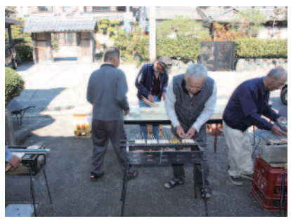
▲前年に皆で仕込んだ味噌を使つての田楽作り

【開催頻度】月1回 第1水曜日午前中 【ところ】榎木町会館 【参加人数】約15人 【参加費】100円