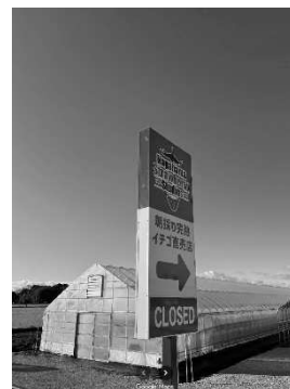
▲長浜ストロベリースタジオ (永久寺町 892-1)