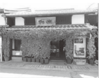
▶ 昨年度事業所部門 最優秀賞 羽洲商店

設置の効果(電気使用量など)・景観・工夫などを評価し、家庭部門・事業所部門のそれぞれで表彰します。※入賞者には園芸用品をプレゼントします。