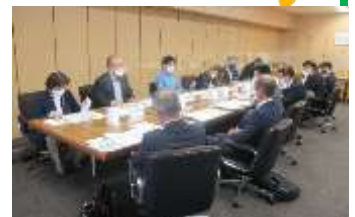
▲ 11/29 に実施した懇談会の様子