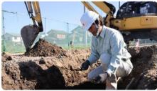
「歴史はロマン。過去と未来を結ぶ、文化財技術職の醍醐味」 #職員インタビュー NEW 2025/10/10