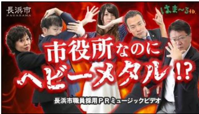
長浜市公式MV 「We Want Ones - 長浜市役所で働こう -」 (職員採用PRソング)