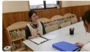
子どもの笑顔と向き合い続けるプロフェッショナル。長浜市児童発達支援センターで働く職員が大切にしていること。 #長浜市役所紹介 #職員インタビュー 2025/10/07