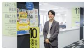
故郷への想いを力に。民間経験を活かし、市民と未来を共創する長浜市役所の働き方 #職員インタビュー #長浜市役所紹介 2025/10/06