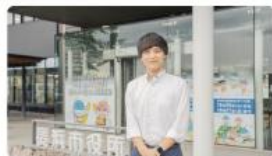
全国転勤の民間メーカーから長浜市役所へ。暮らしと仕事、両方の「チャレンジ」で見つけた新たなキャリアパス #職員インタビュー #長浜市役所紹介 2025/10/06