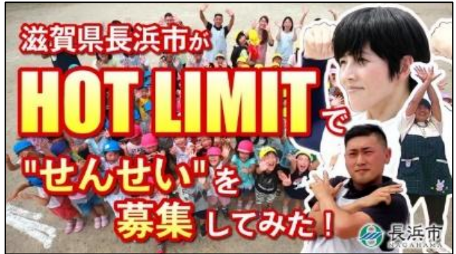
【長浜市公式】 HOT LIMITで“せんせい”を募集してみた！