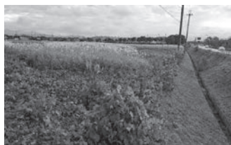
訴訟問題となっている土地

問 ある企業が2023年12月に長浜市相撲町地先に面積43,000㎡の土地を取得し、工場を建設するという情報があり、大変喜ばしいと思っていたところ、この企業から提訴されたところ、令和7年11月20日に報告を受けた。訴額約1億2千万円。なぜ、こんな重大事を市民、マスコミに公表せず隠ぺいするのか、被告である長浜市が顧問弁護士に支払う着手金等はどうするのか。また、このような事態になった経緯を問う。 答 今回の訴訟の件は、個別の企業にかかわる内容、とりわけ企業戦略等企業が積極的に出されていない情報については、慎重に取り扱うべきであり、公の場でお答えすることとは差し控えます。決して隠ぺいをしていたわけではありません。