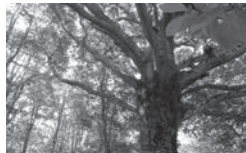
栃ノ木峠の貴重なブナの大木とブナ林

答 風力発電は脱炭素化や地域振興につながる事業として期待する一方、良好な自然環境の保全や自然災害のリスク回避が前提なため、令和5年1月提出の環境アセスメントにおける意見書でも計10項目の適切な措置を講じるよう求めています。環境アセスメントに基づく見直し内容を注視し、事業計画や環境影響について、事業者に継続的に説明の場を設けるよう求められています。