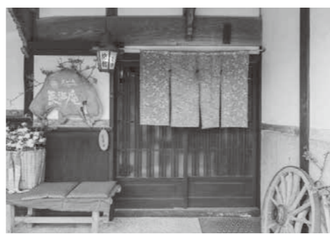
▲昨年の大賞広告物

【募集する広告物の例】 ○老舗店舗などの歴史や伝統を伝えるもの ○企業や店舗などの特徴を優れたデザインで表現したもの ○素材・色彩・文字などを創意工夫した斬新なもの ○照明効果を工夫し、夜間の視認性を高めたもの ○複数のものを統合し、合理的、効果的に制作されたもの ○まちなみや田園と調和し、優れた意匠を有したもの ※市内で、屋外に設置されている広告物(看板)に限ります。 ※何度でも応募いただけます。