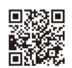
▲コンビニ等証明書交付サービス