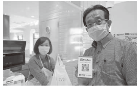
▲キャッシュレス決済をする藤井市長

市では、新型コロナウイルス感染症の影響で落ち込んだ消費を活性化して市内店舗を支援するとともに、このピンチをチャンスととらえ、市内でキャッシュレス決済サービスを広め、コロナ後も見据えた経済活動を進めます。ユーザー数3千万人を超える業界最大のPayPay株式会社と連携し、市内の対象店舗でキャッシュレス決済サービス「PayPay」を利用して飲食や買い物等をした場合に、決済金額の最大20%のポイント還元するキャンペーンを10月1日から実施します。