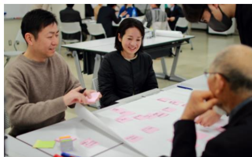
▲ 南長浜地域で、住民や行政、専門家などがまちづくりのアイデアを出し合う活動