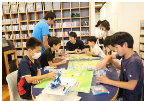
▲ こどもDoまんなかひろば