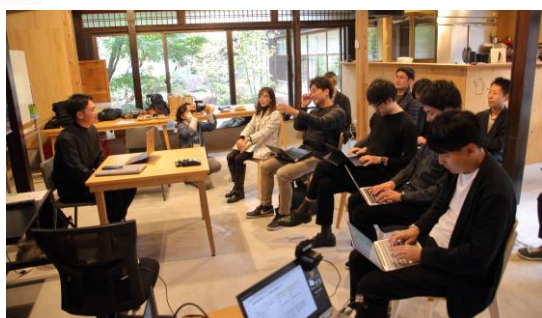
▲ 長浜での起業を支援するプログラム（N-LAP）

◆ 長浜の地域ポテンシャルを生かした企業立地の拡大と新たなチャレンジを応援できる環境づくり