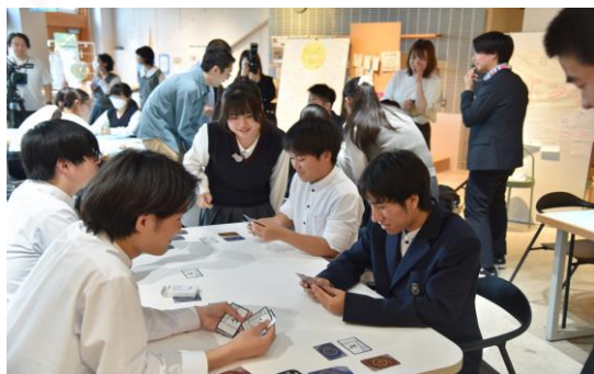
▲ 虎姫高校の学生によるカードゲーム体験会