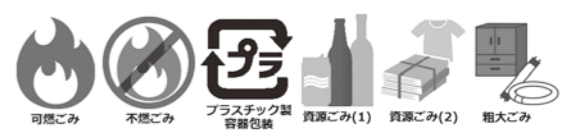
▲ごみ収集カレンダーのイメージ