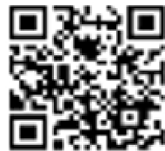
Nagahama-shi Video sobre a forma de lavar as mãos