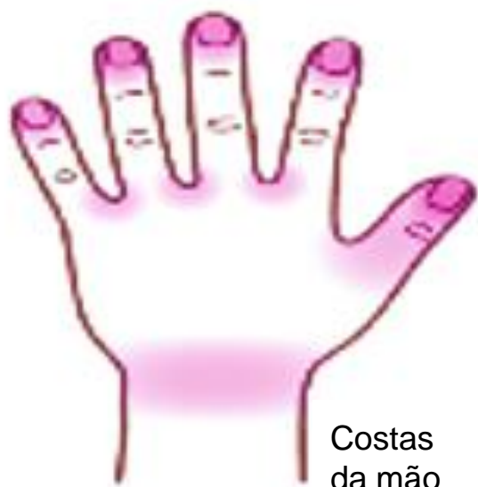
Costas da mão

Confira a maneira correta de lavar as mãos no verso deste panfleto ou assista ao vídeo.