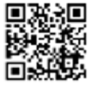
Kousei Roudousho sobre a forma de lavar as mãos