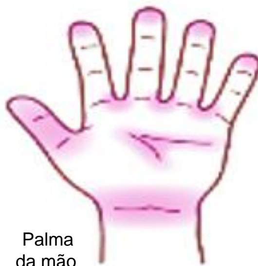
Palma da mão