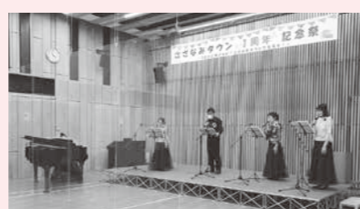
▲フェイスシールド着用やアクリル板を設置してのステージ発表

イベント開催中は、職員によるコロナ対策のほか、参加団体に対策をしっかりと取り組んでもらうなど、全員でひとつになって安心して楽しく開催することができました。