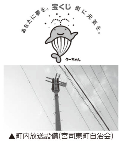
▲町内放送設備(宮司東町自治会)

この助成は、(一財)自治総合センターが、宝くじの社会貢献事業として、地域社会の健全な発展と住民福祉の向上に寄与するために実施しているもので、今後、さらに地域コミュニティ活動が推進されることが期待されます。