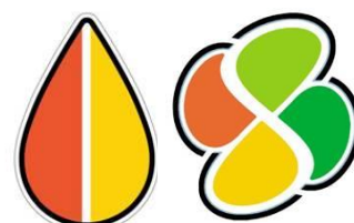
高齢者マーク（左：旧、右：新）

高齢運転者の安全意識を高めるため、各種講習会、交通安全運動等、広報啓発活動を通じて、高齢者マークの積極的な表示の促進を図ります。