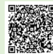
Google Play (Android)