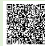
App Store (iOS)