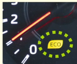
エコドライブランプの例

①エコドライブランプ * を点灯するように運転しましょう。アクセルをふんわり踏んで運転することになり、燃費が良くなります。