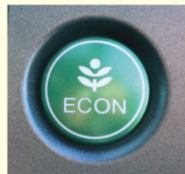
エコドライブスイッチの例

②エコドライブスイッチ * をONにしましょう。車の制御が変わって、ゆっくり加速しやすくなり、燃費が良くなります。