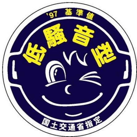
様式第4号（第十条関係）