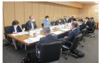
▲ 11/29に実施した懇談会の様子

あわせて、アンケートやニーズ調査等を行う予定をしています。ご協力をお願いいたします。