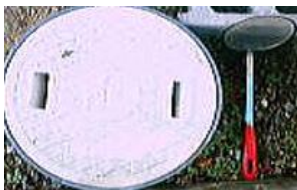
“Kurin Masu” cavidad de drenaje de la cocina