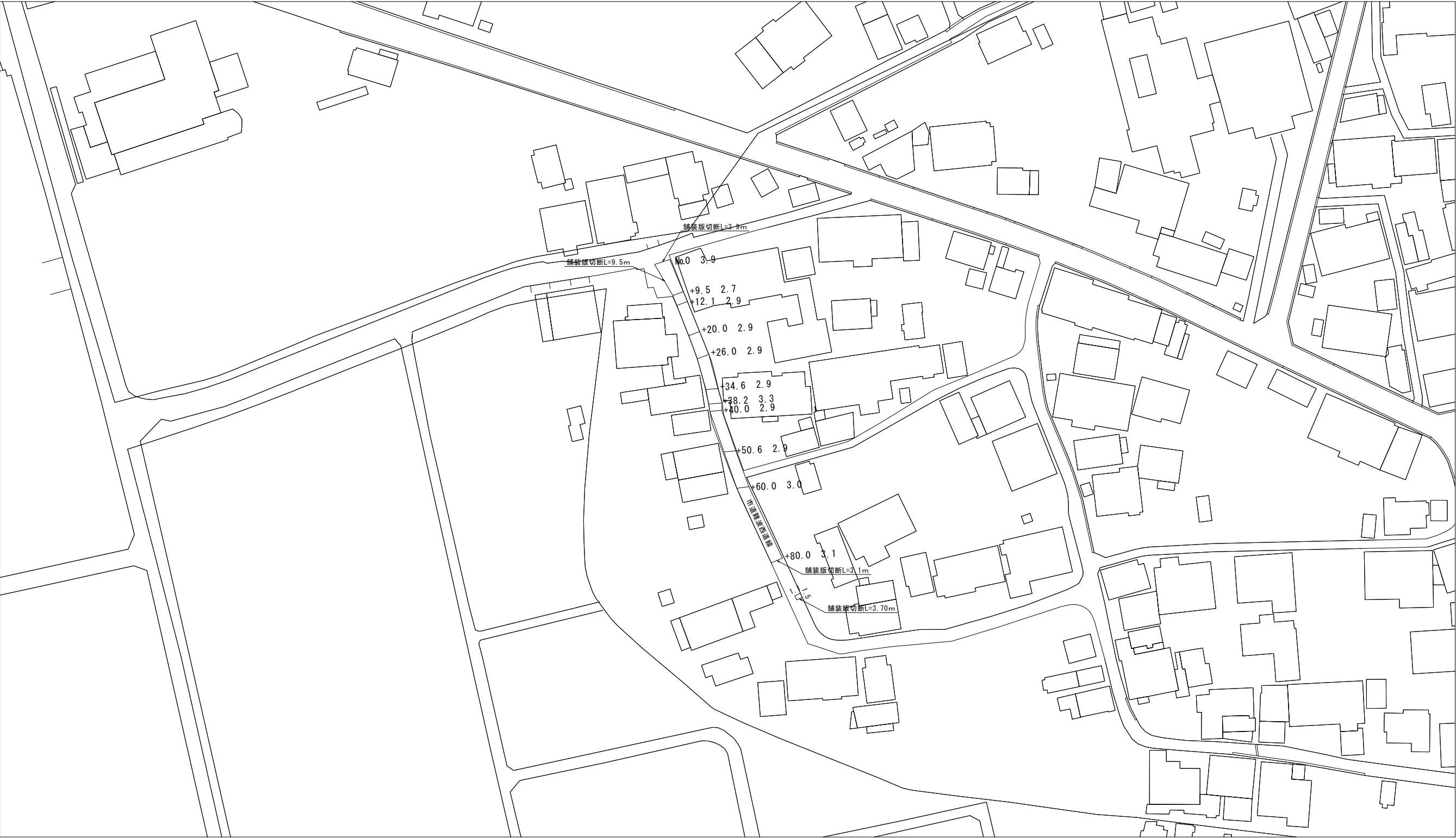
平面图 (3) S=1:500