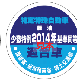
オフロード法 2014年基準適合表示（ラベル）、少数特例表示（ラベル）