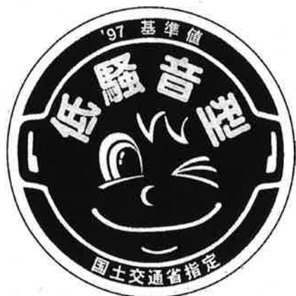
様式第4号（第十条関係） 低騒音型建設機械の標識