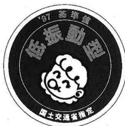
様式第6号（第十条関係） 低振動型建設機械の標識