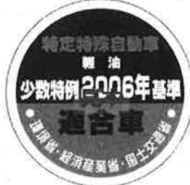
オフロード法 2006年基準適合表示（ラベル）、少数特例表示（ラベル）