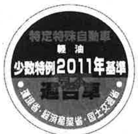
オフロード法 2011年基準適合表示（ラベル）、少数特例表示（ラベル）