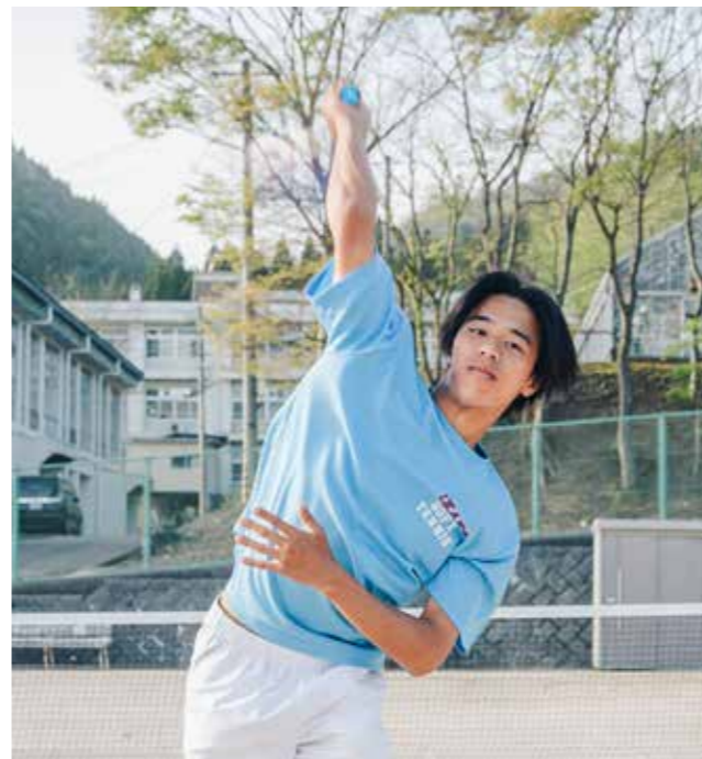
男子ソフトテニス部 Men's SOFT TENNIS CLUB