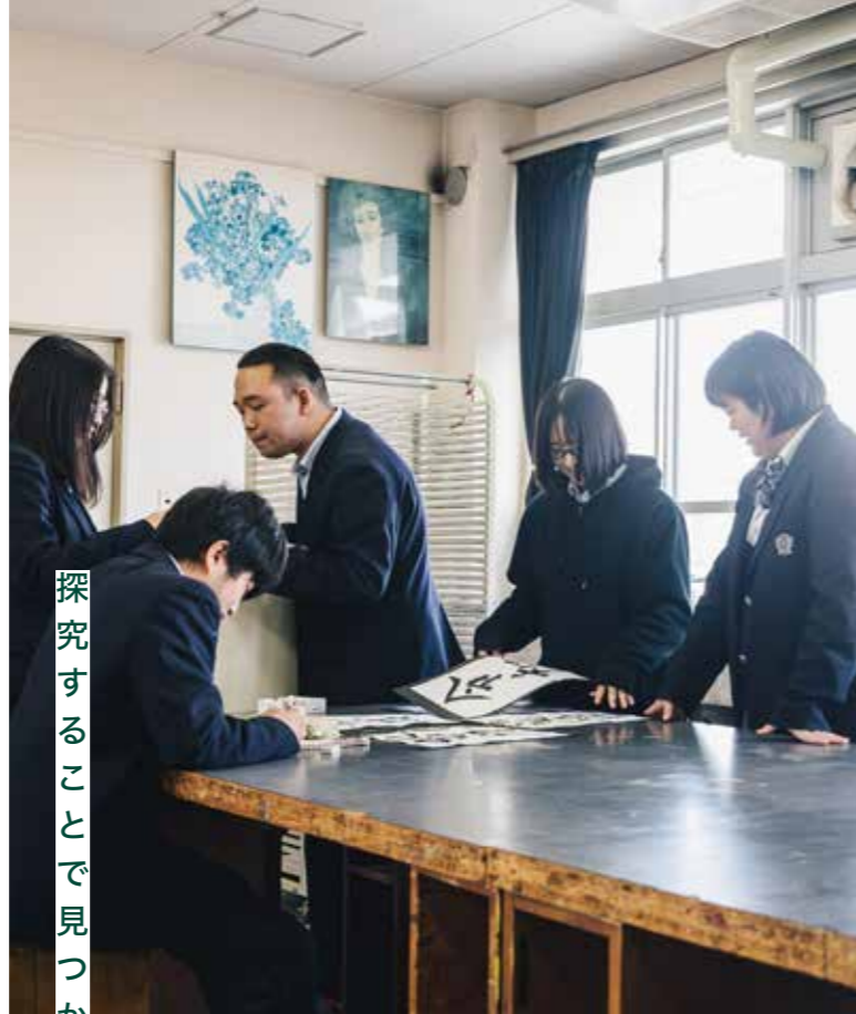
美術書道部 Art And Calligraphy CLUB