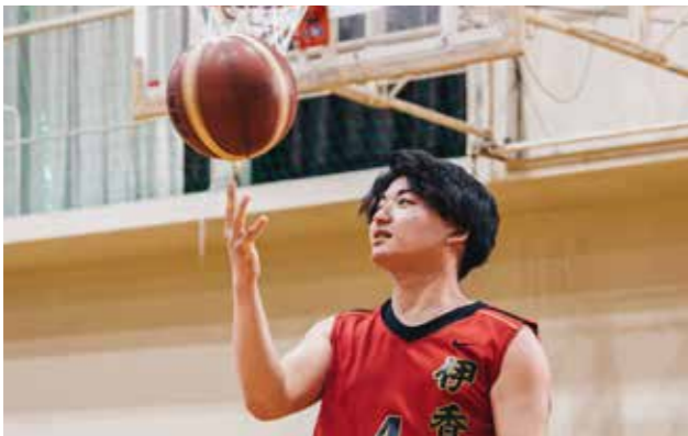
バスケット部 BASKETBALL CLUB