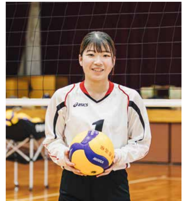
女子バレー部 Women's VOLLEYBALL CLUB