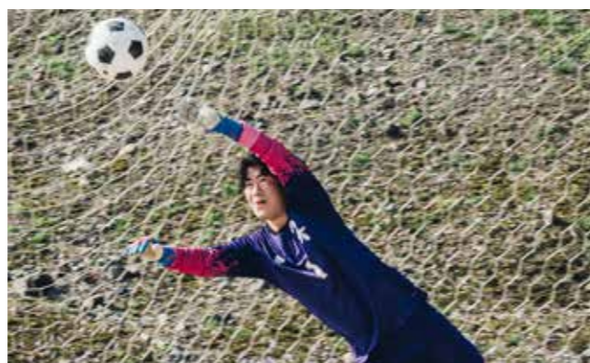
サッカー部 FOOTBALL CLUB