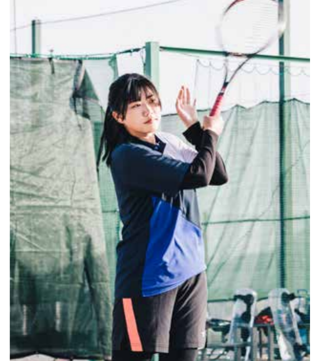
女子ソフトテニス部 Women's SOFT TENNIS CLUB