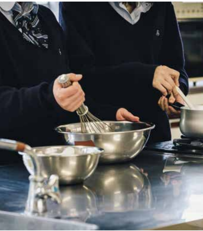
ホームメイキング部 Home Making CLUB