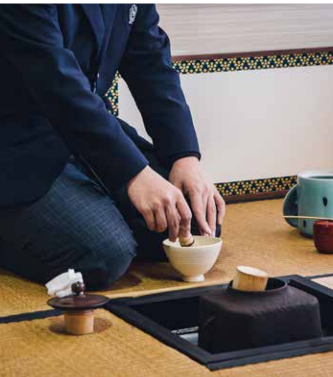
茶華道部 Tea And Flower Arrangement CLUB