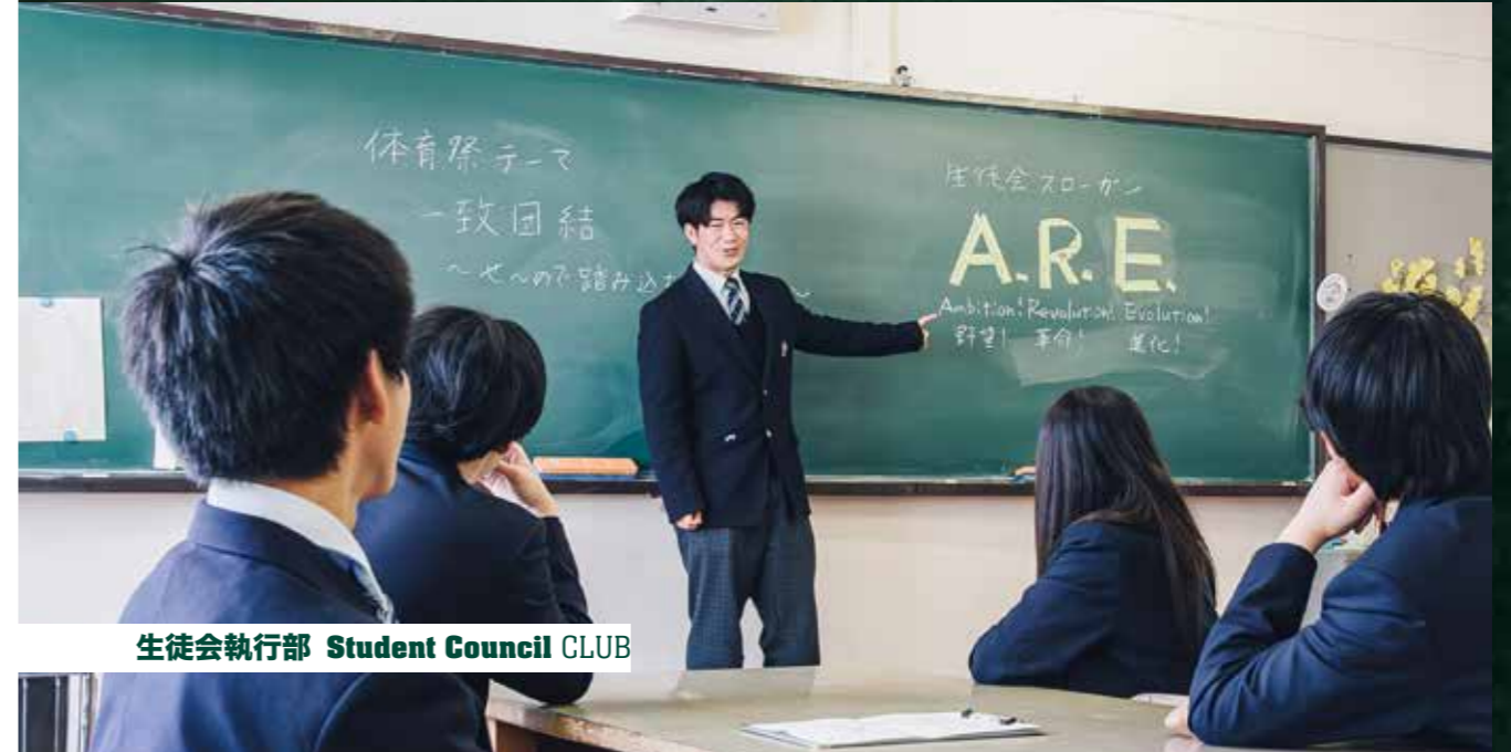
生徒会執行部 Student Council CLUB