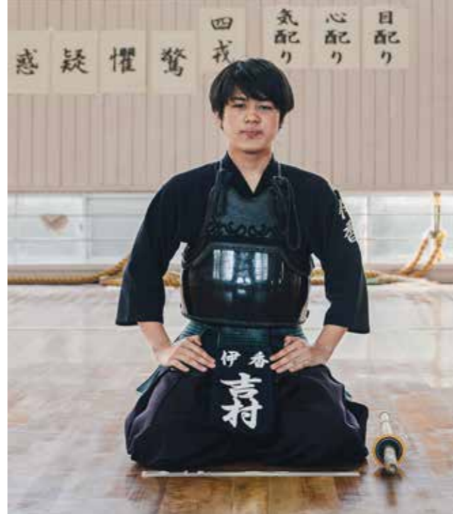
剣道部 KENDO CLUB (強化指定部)