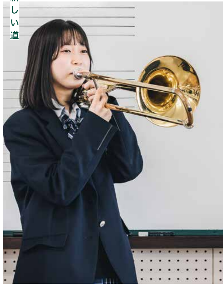
吹奏楽部 Brass Band CLUB