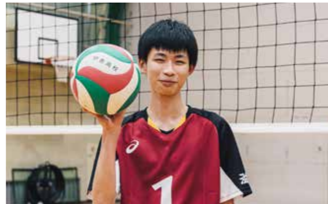
男子バレー部 Men's VOLLEYBALL CLUB