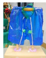
手作りの被布です！