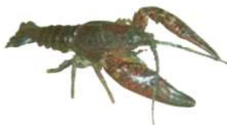
アメリカザリガニ

北海道や東北地方などには、きれいな水にすむもともと日本にいた別種類のザリガニがいる。