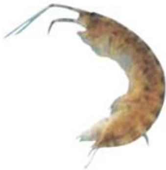
ニホンドロソコエビ