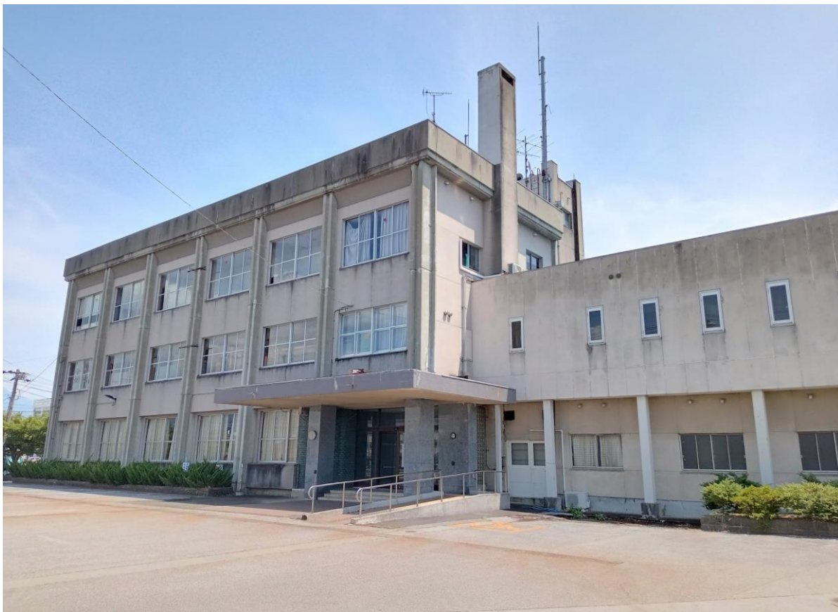
物件北側から撮影