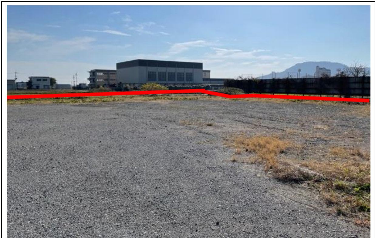
物件北の入口から西向き