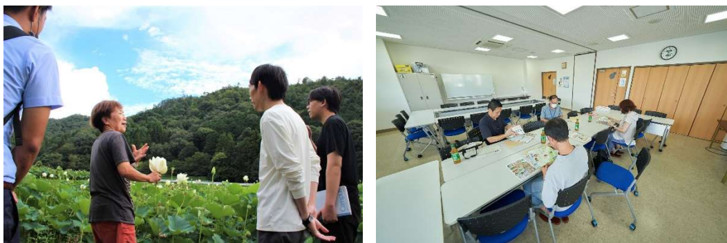
図 2. 2023. 8. 22/24 開催「フィールドワーク」の様子

さらに、JRや幹線道路に加え、今後は（仮称）神田スマートICの開通を控えており、本市屈指の高い交通利便性は、人や資本を呼び込み、好循環を生み出す可能性に満ちています。既存資本と新たな資本を上手に組み合わせることで、更なる発展や新たな価値の創出を期待する声は、全世代共通の願いです。