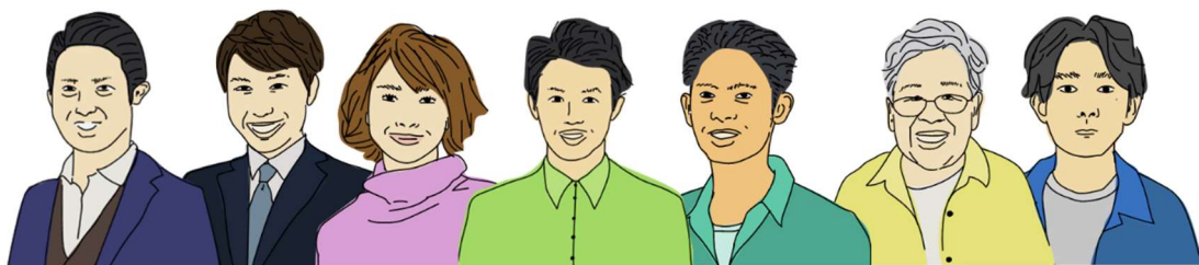
図4. 未来の市民像（未来ペルソナ）

インタビューにあたっては、過去にどのようなまちづくりが行われたかを把握するため「南長浜地域まちづくり年表」を作成し、記憶喚起と共通理解を図りました。