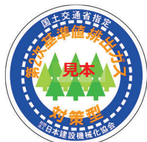
第2次基準値 表示（ラベル）