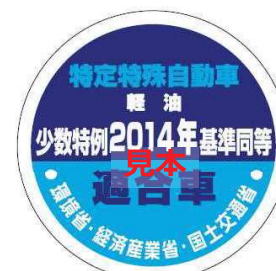
オフロード法 2014年基準適合表示（ラベル）、少数特例表示（ラベル）