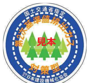
第2次基準値 表示（ラベル）