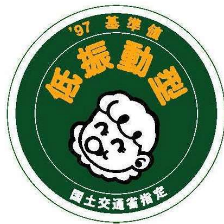
様式第6号（第十条関係）