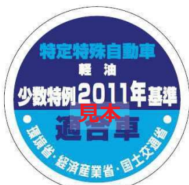
オフロード法 2011年基準適合表示（ラベル）、少数特例表示（ラベル）