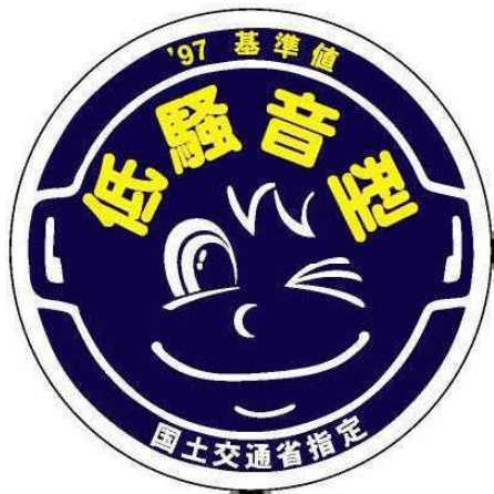
様式第4号（第十条関係）