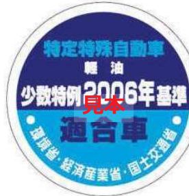
オフロード法 2006年基準適合表示（ラベル）、少数特例表示（ラベル）