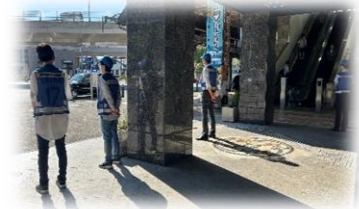
早朝あいさつ運動のようす→