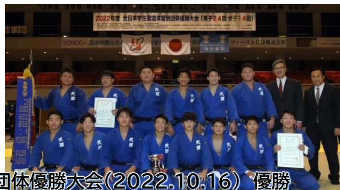
2022年度 全日本学生柔道体重別団体優勝大会(2022.10.16) 優勝