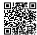
市ホームページ QRコード

※(1)(2)の電子申請フォームは市ホームページの「令和6年度長浜市まちなか出店支援事業補助金」のページ内にリンクがあります。