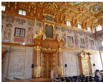
アウグスブルク市庁舎黄金の間