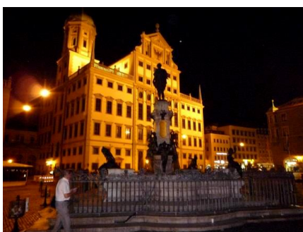
アウグスブルク市庁舎