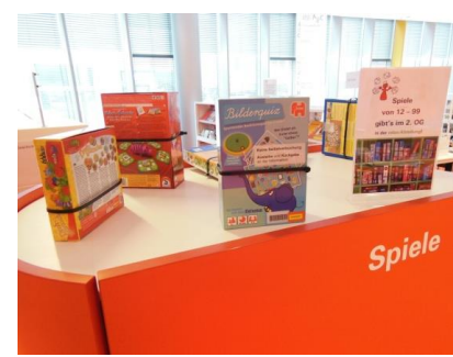
デザイン性の高い新市立図書館

長浜市とアウグスブルク市との姉妹都市交流の状況等については、長浜市のホームページ「姉妹都市」のページでご確認ください。( https://www.city.nagahama.lg.jp/0000000212.html )