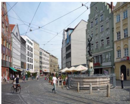
アウグスブルクの街並み