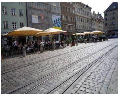
街のいたるところにあるオープンカフェ