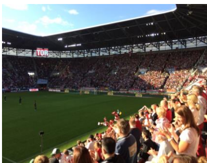
サッカーFCアウグスブルクの試合