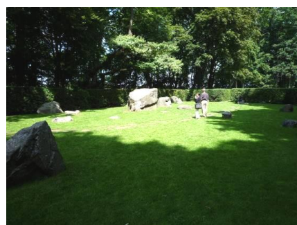
ディーゼル記念公園