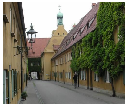
世界一古い福祉施設「フッゲライ」