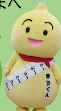
「むびょうたん+1」健診くん 長浜市健康づくり推進キャラクター