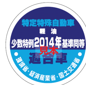
オフロード法 2014年基準適合表示（ラベル）、少数特例表示（ラベル）